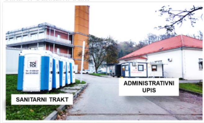
Slika 4: Sanitarni trakt

KLINIKA ZA INFEKTIVNE BOLESTI „DR. FRAN MIHALJEVIĆ” Mirogojska 8, Zagreb