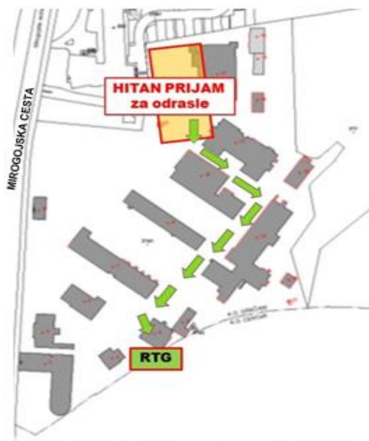
Slika 5: Put od hitnog prijma odraslih bolesnika do RTG-a