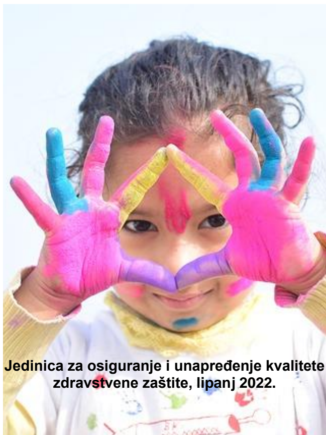
Jedinica za osiguranje i unapređenje kvalitete zdravstvene zaštite, lipanj 2022.

Cjepivo protiv hepatitisa A se primjenjuje kod osoba koje imaju povećan rizik od zaraze HAV-om. Daje se u dvije doze, a zaštita je doživotna.