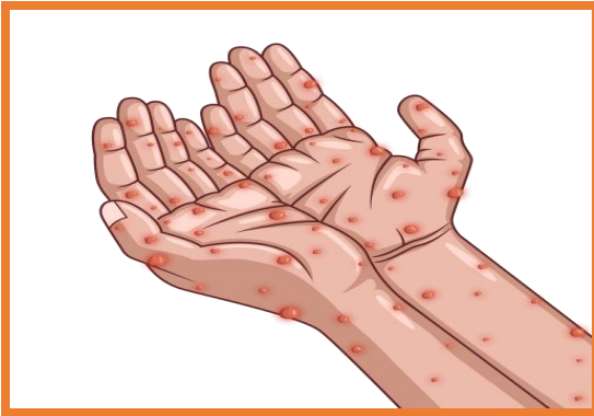
Slika 2: monkeypox virus PNG