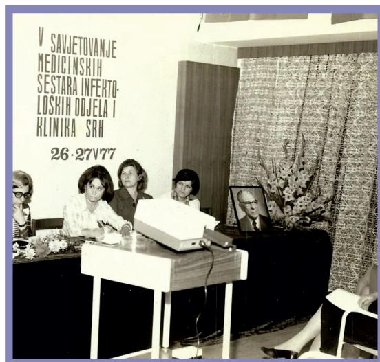
Slika 2. Peto savjetovanje medicinskih sestara infektoloških odjela i klinika SRH, 26. – 27. 5. 1977., Pula