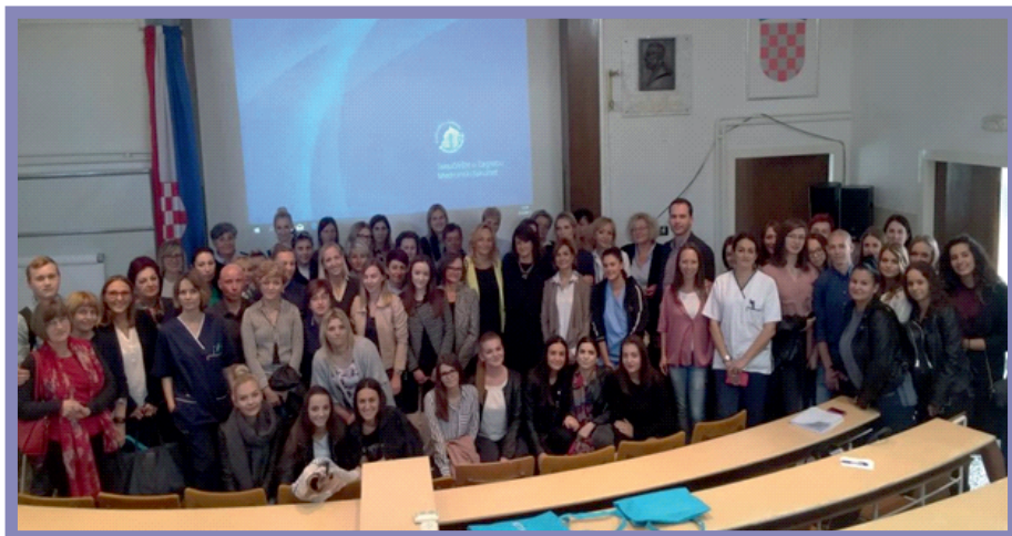
Slika 16. Drugi tečaj III. kategorije Standardne mjere zaštite, 22. 9. 2017., Zagreb