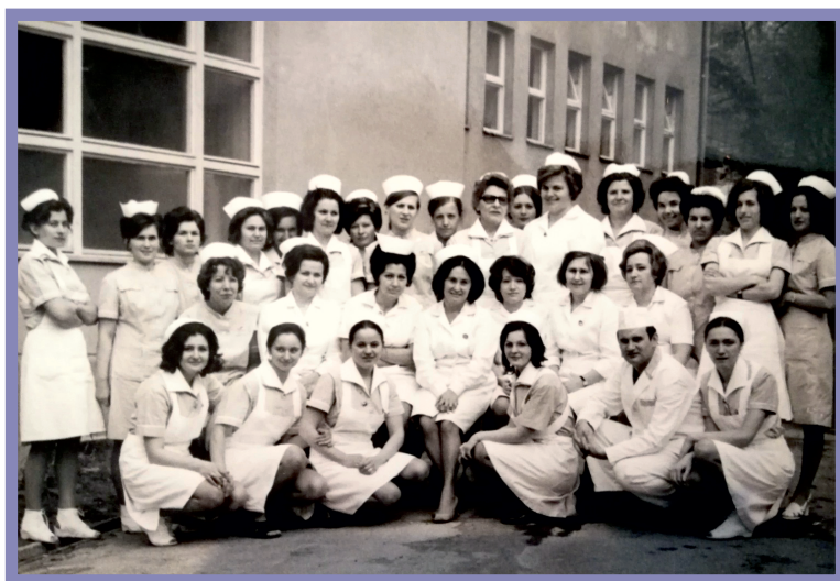
Slika 1. Zagreb, 11. 6. 1973., Klinika za zarazne bolesti