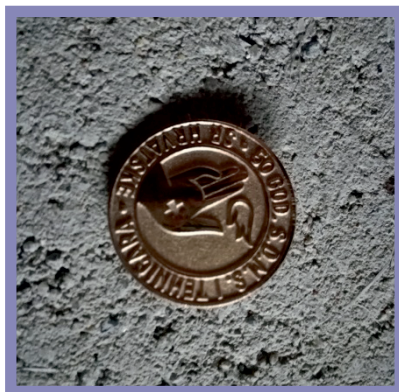
Slika 19. Zlatna značka dodijeljena Smiljki Nell 1979. godine na proslavi 50. godišnjice rada Saveza društava medicinskih sestara - tehničara SRH u Zagrebu