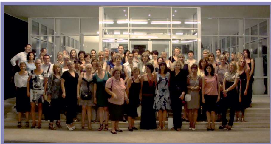
Slika 14. Prvi Kongres Infektološkog društva HUMS-a, Šibenik, 9. - 10. 11. 2011.