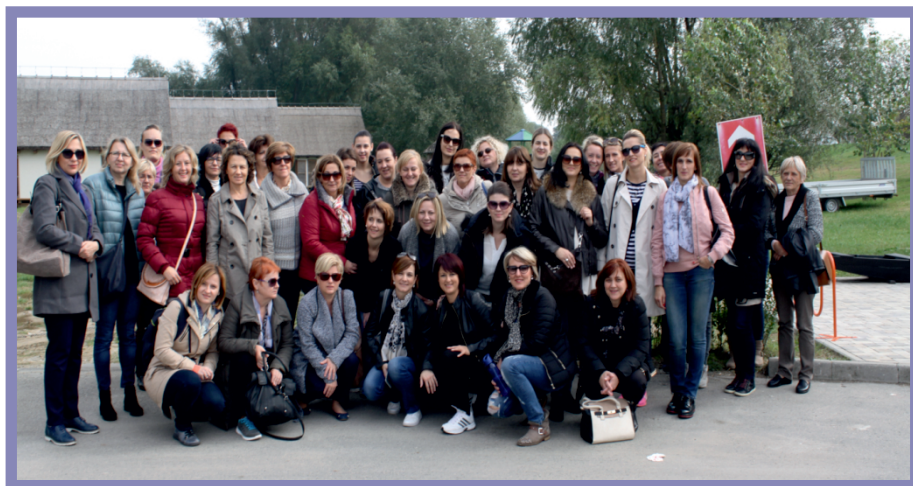
Slika 15. Drugi Kongres Infektološkog društva HUMS-a održan u Osijeku, 14. - 15. 10. 2016.